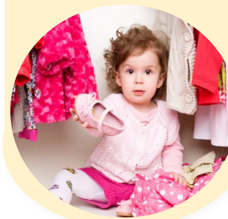
Одежда, обувь, сумки