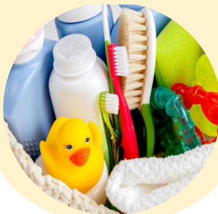
Средства личной гигиены